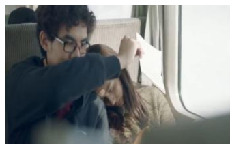
แพนเดย์...แพนกันแค่วันเดียว

เรื่อง แพนเดย์...แพนกันแค่วันเดียว เด่นชัยปลอมตัวเป็นแฟนของนุ้ย ตอนที่นุ้ยความจำเสื่อมหนึ่งวัน นุ้ยซึ่งเป็นคนที่เด่นชัยแอบรักมาตลอด เธอได้นอนหลับบนรถเมลระหว่างทางไปเที่ยวด้วยกัน เด่นชัยได้ดึงนุ้ยมานอนขบไหล่เพราะเห็นนอนลำบาก และตอนนั้นก็มีแสงแดดส่องเข้ามาที่หน้าของนุ้ย เด่นชัยจึงเอากระดาษขึ้นมาบังแดดให้นุ้ย